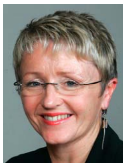
Liv Signe Navarsete

Ministerin für Verkehr und Kommunikation Minister of Transport and Communications Ministre des Transports et des Communications