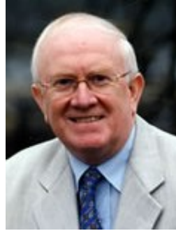
Pat the Cope Gallagher

Staatsminister für Verkehr Minister of State for Transport Ministre adjoint chargé des Transports